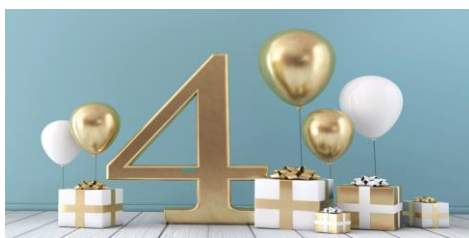
4 anos de consulta de estomaterapia de eliminação intestinal do CHEDV

Em maio de 2022 comemorou-se o 4º aniversário da consulta de Estomaterapia de eliminação intestinal do CHEDV, com uma tertúlia dirigida aos enfermeiros da referida instituição intitulada “Cuidados no pós-operatório imediato” .