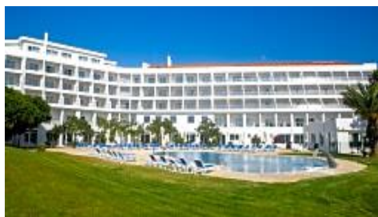
MH Atlântico – Peniche

É com muito prazer que a Associação Portuguesa de Enfermeiros de Cuidados em Estomaterapia prepara mais uma edição do seu Congresso Nacional , que se irá realizar nos dias 24 e 25 de fevereiro, em Peniche.