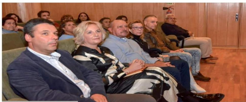
Quatro utentes do IPO, todos ostomizados, partilharam experiências

No dia 15 de Novembro, inserido nas comemorações dos 60 anos do IPO de Coimbra, a Consulta de Estomaterapia do IPOC, comemorou o dia Mundial da Pessoa com Ostomia, dando voz a quem vive com um estoma, promovendo a realização do Fórum, Vidas que falam . Este Fórum aberto á comunidade contou com a participação de Pessoas que no decurso do seu processo de doença foram confrontados com a necessidade de uma ostomia.